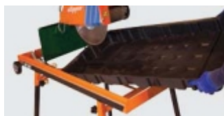
TAVA DE APA DETASABILA