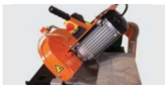
CAP REGLABIL SI CARUCIOR MARE